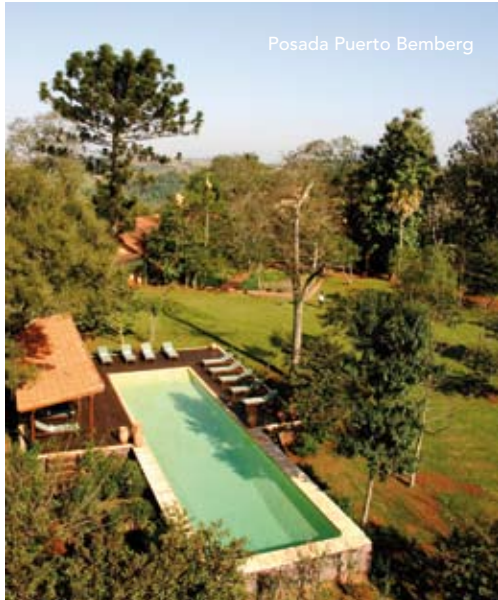
Posada Puerto Bemberg