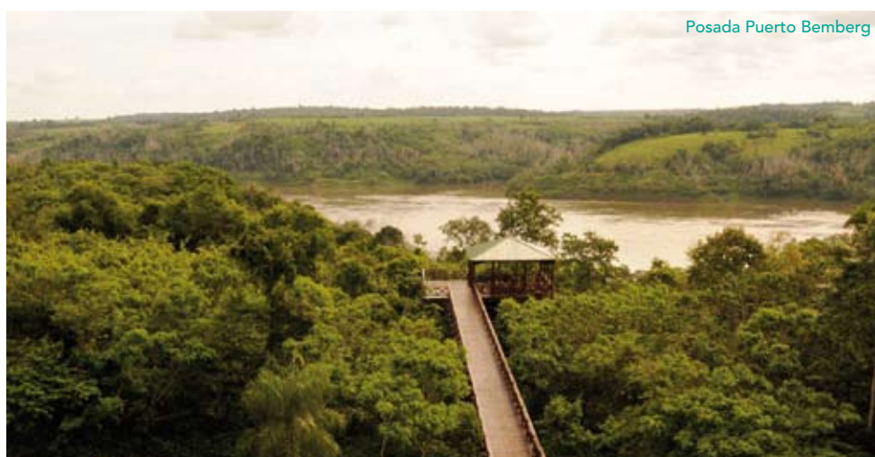
Posada Puerto Bemberg