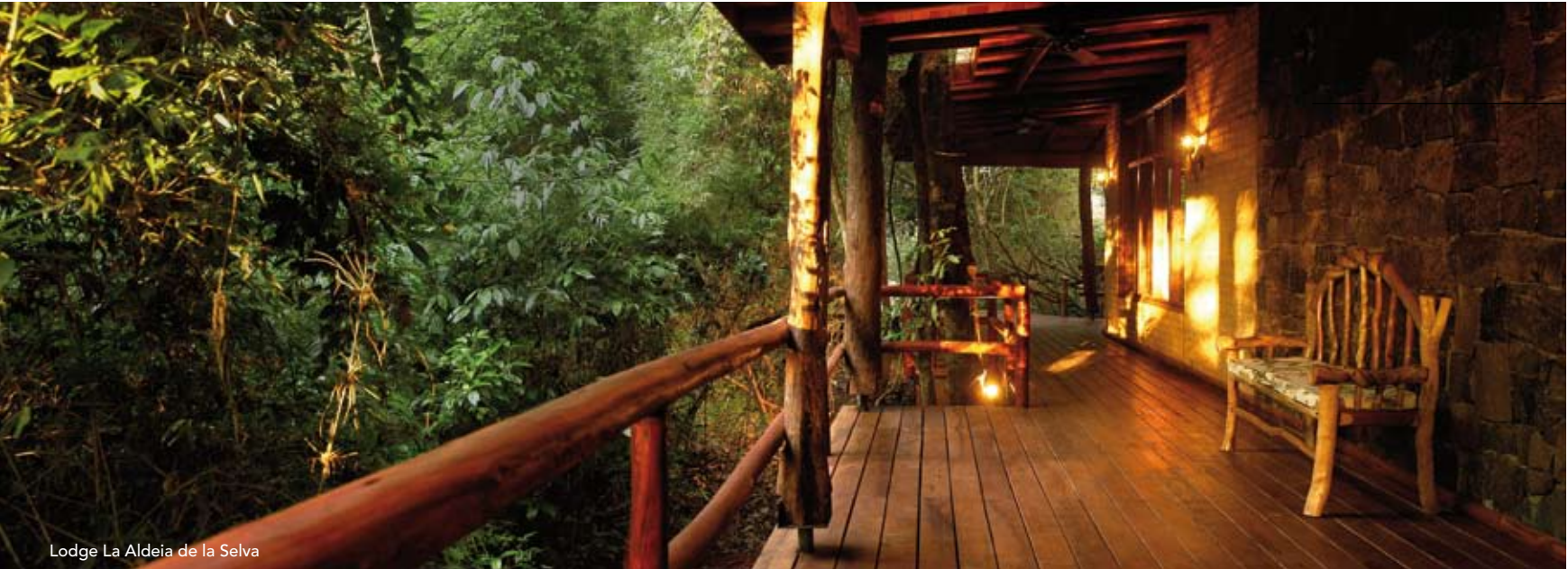
Lodge La Aldea de la Selva