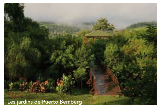
Les jardins de Puerto Bemberg