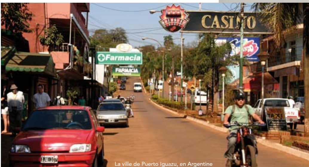
La ville de Puerto Iguazu, en Argentine