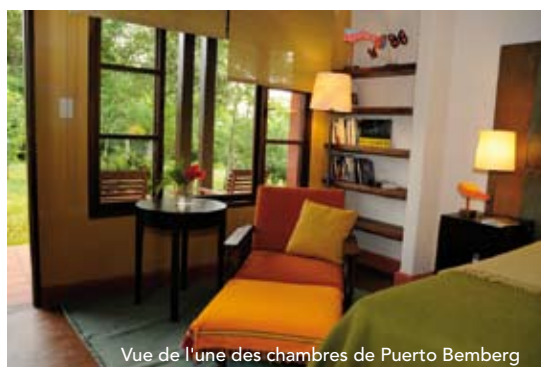
Vue de l'une des chambres de Puerto Bemberg